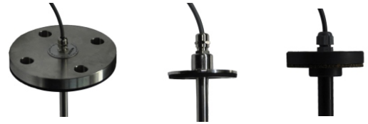
FLANŞLI SEVİYE SENSÖRÜ

Genelde sensörler tanka yukarıdan monte edilecek şekilde üretilmektedir. Tankta yukarıdan müdahale edilemeyen durumlar yada üstünde yer olmayan tanklar için yandan montajlı sensör imalatıda yapılabilmektedir.