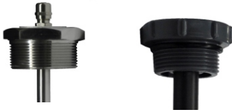
DİŞLİ SEVİYE SENSÖRÜ

SENSÖR BAĞLANTI TİPİ: Sensörler takılacakları tankın özelliklerine yada isteğe göre tanka bağlantı kısmı dişli yada flanşlı olarak üretilebilmektedirler.