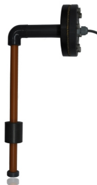
YANDAN MONTAJ SEVİYE SENSÖRÜ

Genelde sensörler tanka yukarıdan monte edilecek şekilde üretilmektedir. Tankta yukarıdan müdahale edilemeyen durumlar yada üstünde yer olmayan tanklar için yandan montajlı sensör imalatıda yapılabilmektedir.